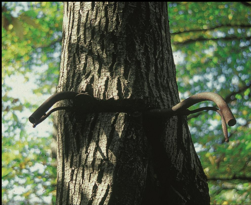
L'ALBERO DELLA BICICLETTA (Sitran di Puos d' Alpago)