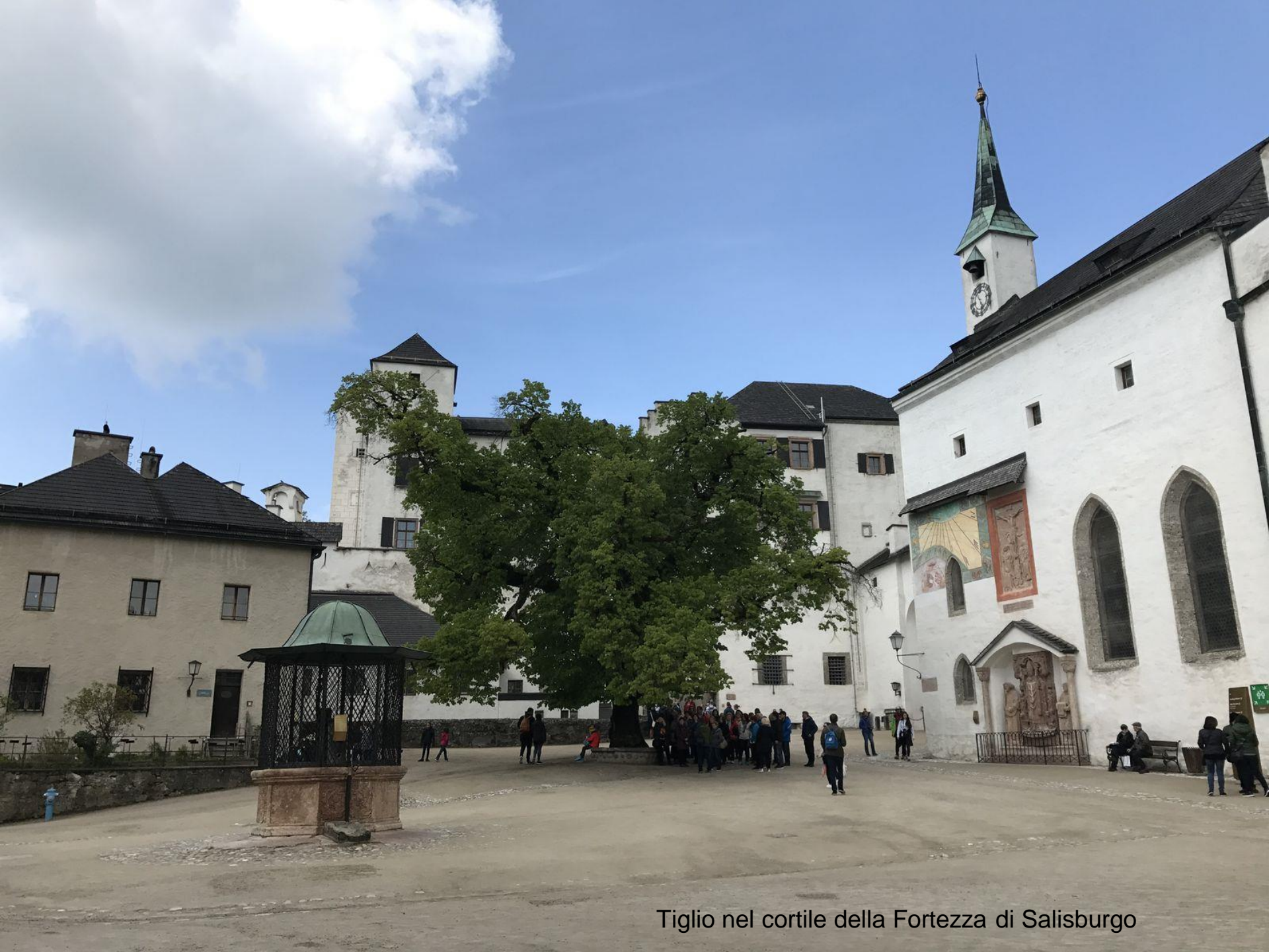
Tiglio nel cortile della Fortezza di Salisburgo