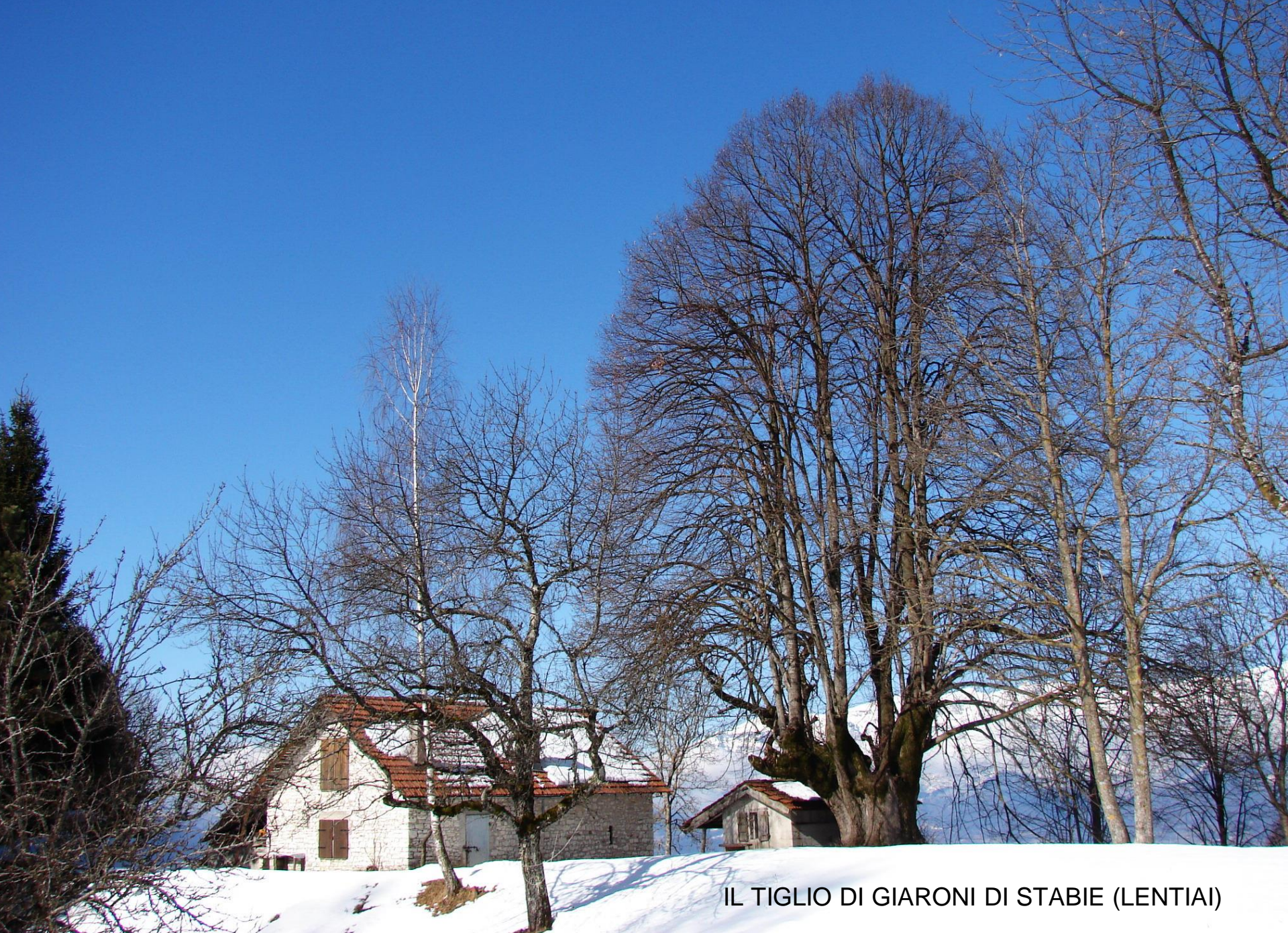
IL TIGLIO DI GIARONI DI STABIE (LENTIAI)