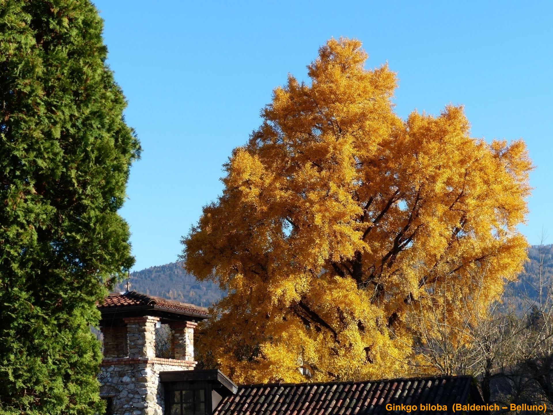
Ginkgo biloba (Baldenich – Belluno)