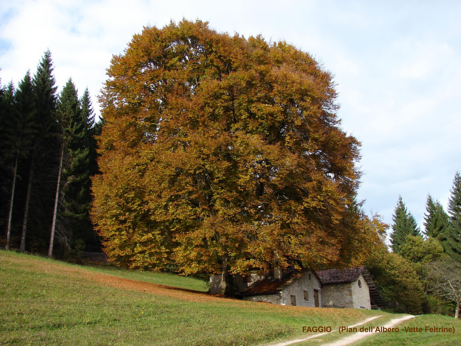
FAGGIO (Pian dell'Albero -Vette Feltrine)