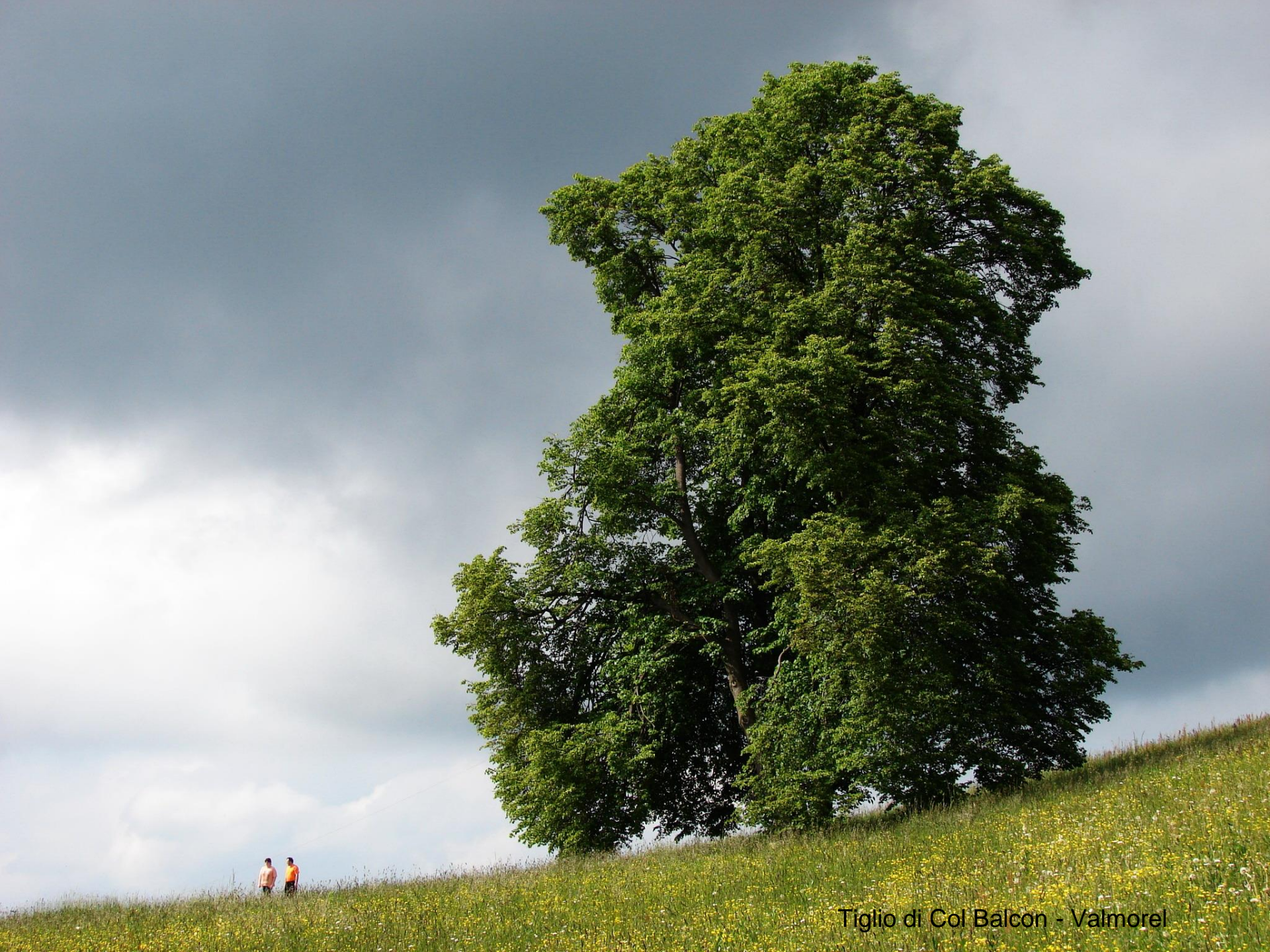
Tiglio di Col Balcon - Valmorel